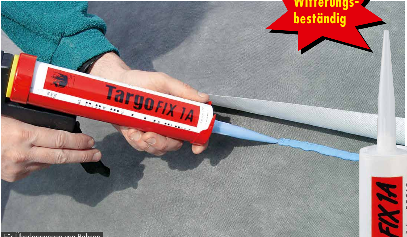
Für Überlappungen von Bahnen