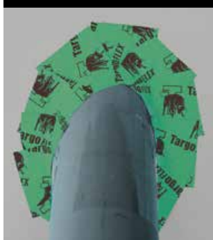
collage aux tuyaux de ventilation étanche à l'air