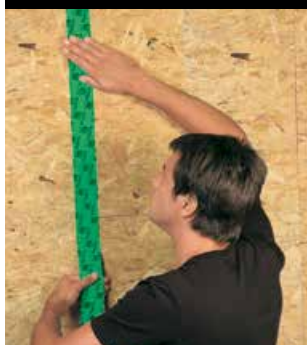
collage des panneaux OSB étanche à l'air