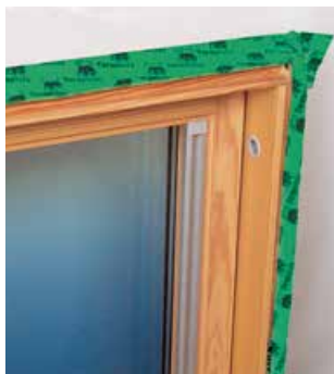
collage aux fenêtres de toit étanche à l'air