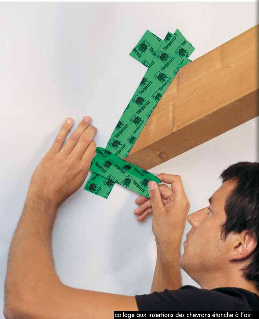
collage aux insertions des chevrons étanche à l'air