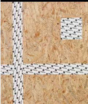
Collage hermétique à l'air des panneaux OSB