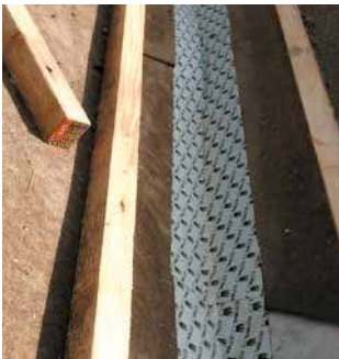
Raccords des sous-toitures et des coupe-vent