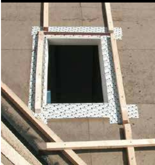
Fixation des joints des coupe-vent