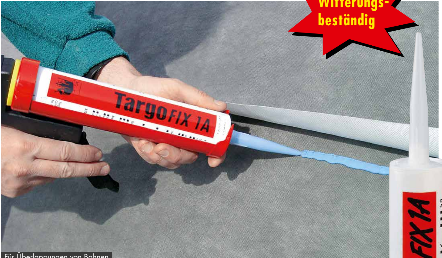
Für Überlappungen von Bahnen