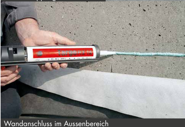
Wandanschluss im Aussenbereich