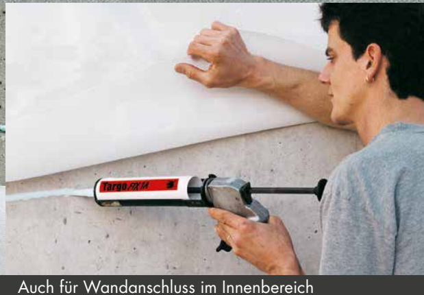
Auch für Wandanschluss im Innenbereich