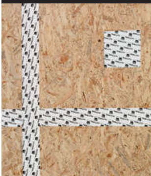
OSB-Platten luftdicht abkleben